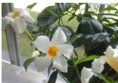
パンドレア ノウゼンカヅラ科

ロビーの窓際で可憐な白い花を咲かせています。そのたたくまいは外の熱気を少し忘れさせてくれるようです。