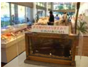
「阿蘇みつばち牧場杉養蜂園」女王バチの展示

「阿蘇みつばち牧場杉養蜂園」では、ミツバチや養蜂のことを、ビデオ・展示物で説明して頂きました。ショップもありさまざまな種類のはちみつを販売していました。