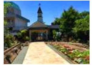
風の丘大野勝彦美術館

今回のツアーは阿蘇へ行きました。訪れたのは南阿蘇村の「風の丘大野勝彦美術館」と「阿蘇みつばち牧場杉養蜂園」です。